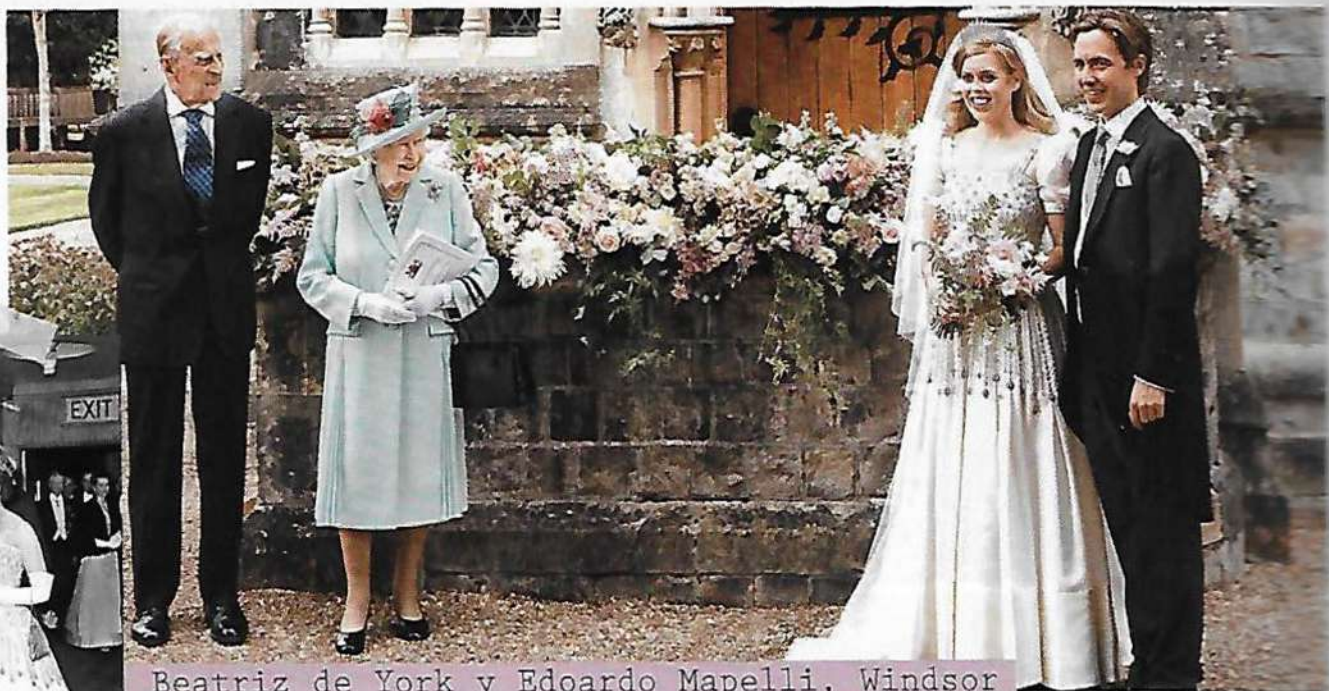
Beatriz de York y Edoardo Mapelli, Windsor