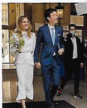
Natalia Vodianova y Antoine Arnault, París